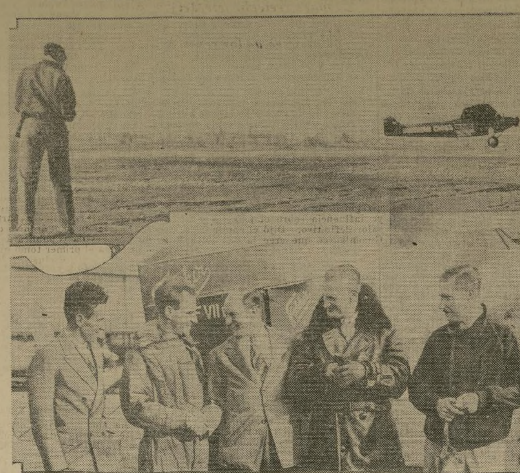
De nuevo en Oakland, California, punto de partida en su vuelo alrededor de la Tierra, la tripulación del "Southern Cross" es recibida con expresiones de júbilo. En el grabado superior se ve la nave al arrancar de Roosevelt Field para Chicago en la última etapa de su hazaña. En la fotografía inferior, Anthony Fokker felicita a Kingsford-Smith y sus acompañantes.