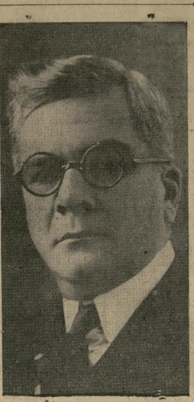
General Gerardo Machado

Esta objeción se reflejó el año de la declaración.