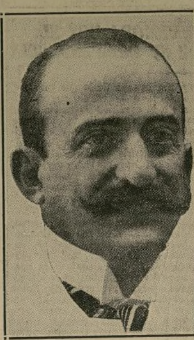
Conde de Romanones

El discurso del caudillo liberal defraudado a los republicanos pero es aplaudido por los sensatos.—Pidió la abolición de los soldados "de cuota"—Demandó la subdivisión de las tierras y la guerra al latifundio.