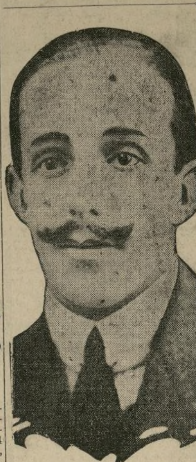
S. M. Alfonso XIII

Choca violentamente su vehículo con otro y se destruye el parabrisas del regío.—El príncipe de Asturias agasajado en París.—La familia real en Santander