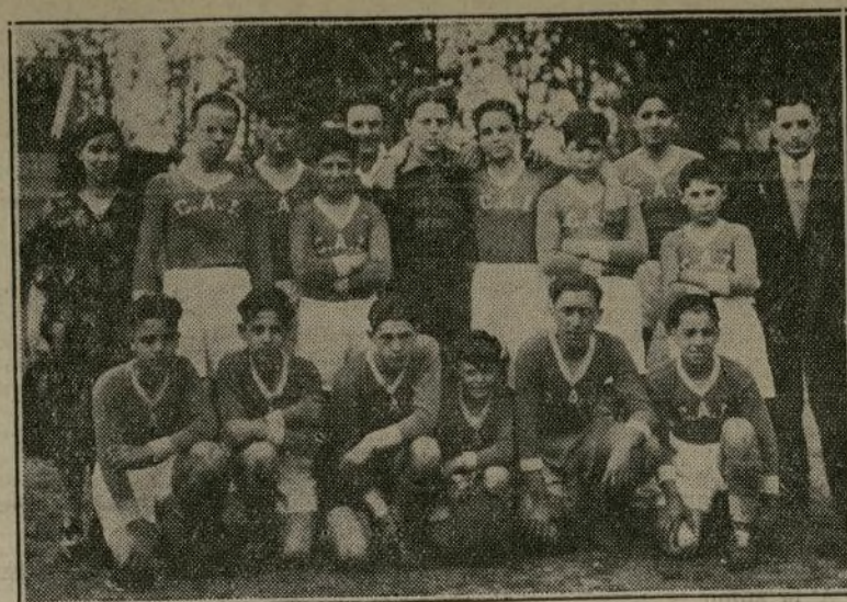
Equipo infantil Centro Asturiano, que el próximo domingo se enfrentará en el Ulmer Park, Brooklyn, con la Juventud Asturiana de Baycane, N. J.