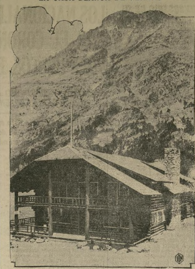
Esta será la "Casa Blanca" durante las vacaciones en el presente verano de Mr. Hoover. Este pintoresco chalet está situado a más de nueve mil pies de elevación en el Glacier National Park.