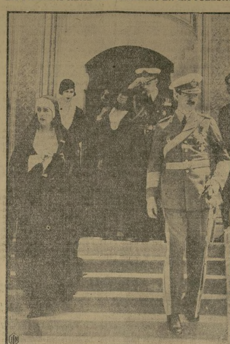
El rey Carol de Rumania y su madre la reina madre María, saliendo un domingo de la catedral de St. Arges. En la parte de atrás pueden verse al príncipe Nicolás y a la reina Elena.