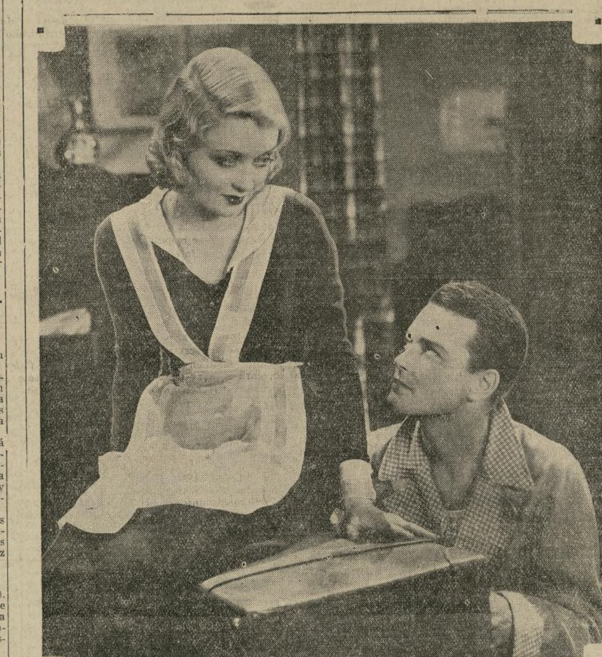
Constance Bennett y Lew Ayres en una escena de "Common Clay", la cinta que se exhibe esta semana en el "Roxy".

La cinta de Ramón Novarro que iba a llevar el nombre de "The Singer of Seville", se llamará por fin