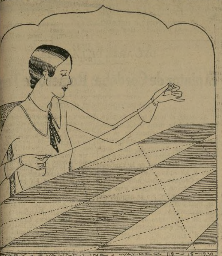
Colóquese el colchón en el bastidor.

Ahora que están en boga los colchones a cuadros de distintos colores, ella misma, es oportuno que el mejor modo de prepararlos sea de empezar a hacer el col-