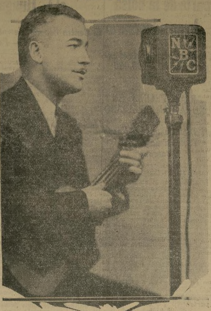
Popular artista de la red National, quien con sus caracterizaciones y diálogos cómicos radiados, mañana y tarde, por la estación WJZ, se ha logrado enorme popularidad entre la afición radio-escucha.