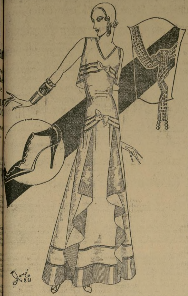
Volantes y rosa púrpura supremamente elegantes con bandas de plata, realizados por una graciosa silueta.

LUJOS INOCENTES QUE NOS PROPORCIONAN PLACER