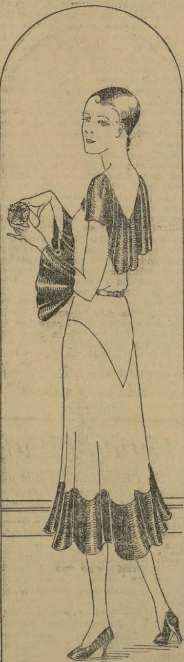
El arreglo de las cerillas era para ella un placer.

costaba ningún dinero adicional para ella un placer.