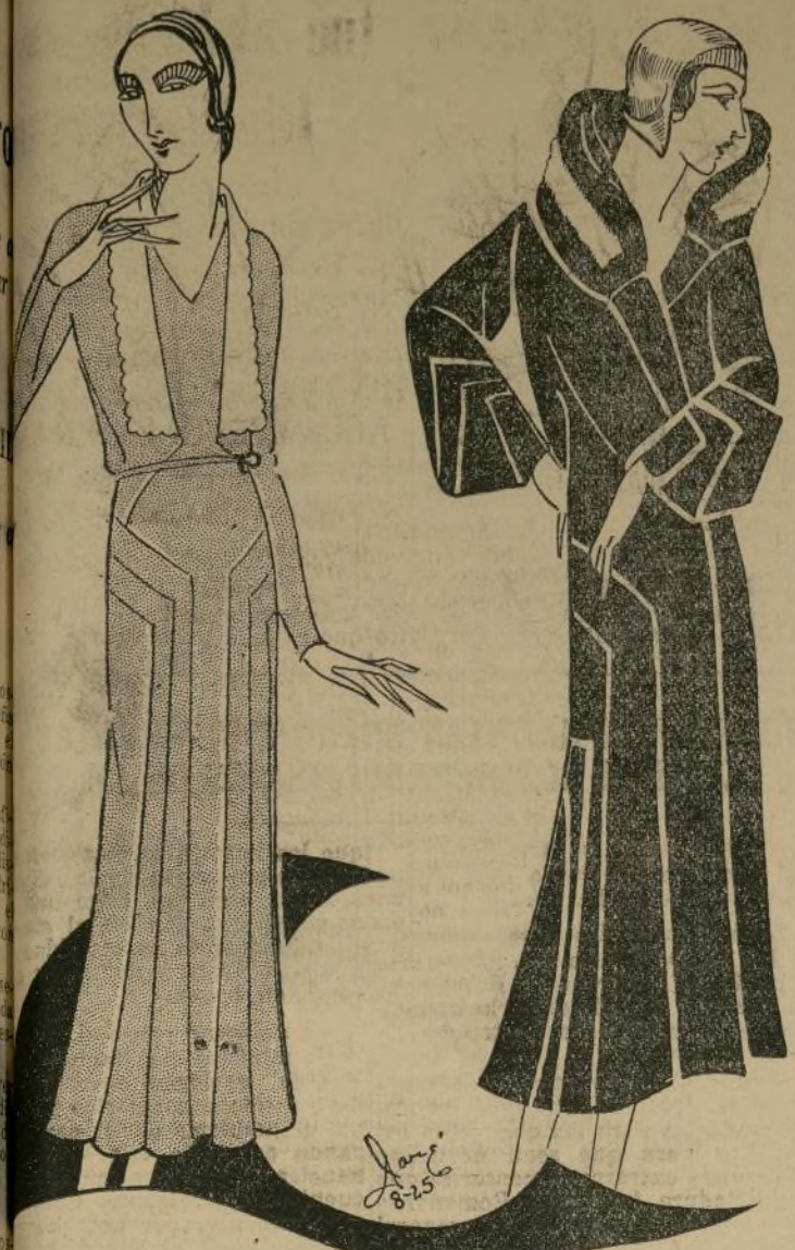
Un traje de crepé azul obscuro y elegante abrigo de lana

El lunes pasado ofrecimos dar una atención a mis recomendaciones, dejé una columna y siguieron los modelos de crepé azul obscuro y elegante abrigo de lana. Me siento descontenta cuando al hallarme con alguna joven entusiasta me dice: "¡Oh, con que Ud. es Daré! He estado leyendo sus artículos por años!" Y al fijarme en su atavío, noto que va vestida con pésimo gusto, indiferente al