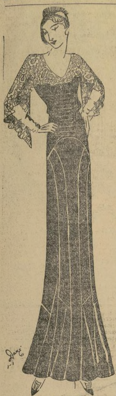
Lindo vestido de domingo por la noche en terciopelo con adornos de encaje

ción y se le añaden dos o tres yemas de huevo, y déjese enfriar.