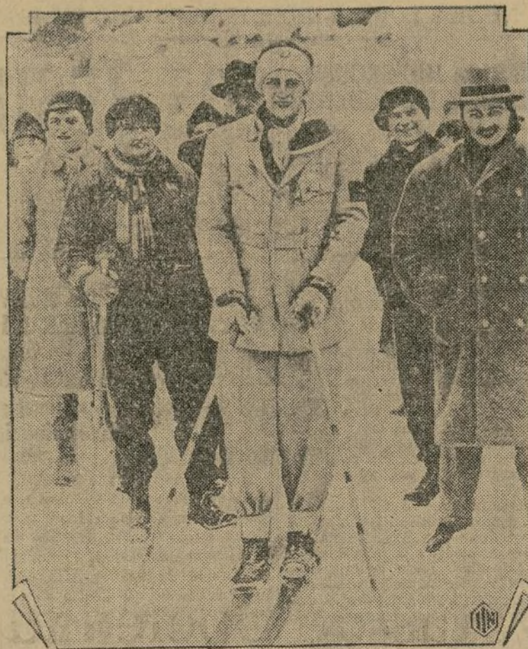
El príncipe Nicolás de Rumania, mientras ventila su pleito con el rey Carol, su hermano, acerca de si va o no seguir casado con la señora con quien contrajo matrimonio hace varias semanas contra la voluntad del monarca, se distrae dedicándose al deporte de los patines. Estos hombres de la casa real de Rumania que manera de dar qué hablar con sus llos de faldas, ¿verdad? Total eso le pasa a cualquiera desde que el mundo es mundo.

CIUDAD VATICANA, enero 17. (P).—El "Observador Romano" asumió en un artículo que la ayuda religiosa a los fieles de Méjico "se verá pronto imposible, por las medidas tomadas por el estado mejicano".