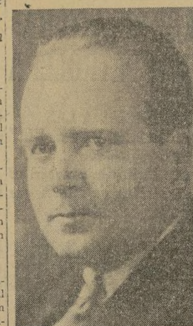
Ingeniero Juan de la Cierva

WASHINGTON, D. C., enero 20. (P) — El joven y talentoso ingeniero español don Juan de la Cierva, inventor del autogiro, estuvo hoy en la Casa Blanca, en esta ciudad, hablando con el presidente Hoover sobre asuntos de aviación y los adelantos que en la misma se efectuarán próximamente.