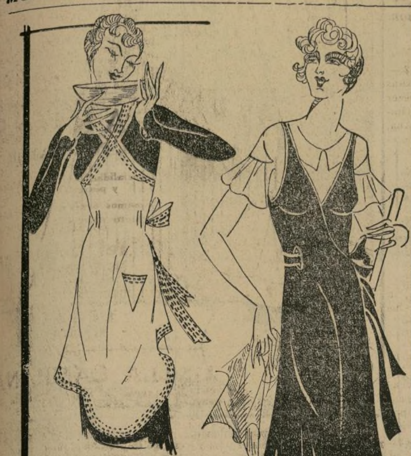
El chic de las amas de casa

New York, enero 22.—En estos días me ha entrado el furor del trabajo doméstico, y es bueno que se aprovechen ahora antes que tome una doncella que lo haga todo por mí. Me divierto grandemente atendiendo a la casa, atendiendo a dos niños y una hermana, llena de buena voluntad, pero no muy eficiente. Luego ser una Crítica de Modas! ¿Qué les parece? He hecho unos delantales muy bonitos para mi hermana y para mis hermanas por mi misma. Los delantales deben ser chic y elegantes, cómodos y que duren, ajustados, pero que dejen libertad de movimiento y fáciles para lavar y planchar. Y principalmente que sean baratos. Les he diseñado dos estilos hoy. Son de muselina, muy barata y también sirve para los trajes de los bebés para verano, delantales para la madre, pijamas de playa y otros usos.