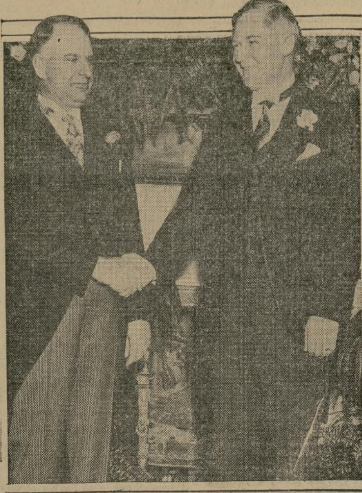
EL EX GOBERNADOR de Nueva Jersey, Mr. Morgan F. Larson, felicita a Mr. Harry Moore, que acaba de tomar posesión de dicho cargo en la ciudad de Trenton. Las ceremonias revistieron gran sencillez este año, con lo cual el estado se economizó $25,000. ¿Bonita suma, verdad?

EL GOBERNADOR SALIENTE Y EL ENTRANTE DE N. J.