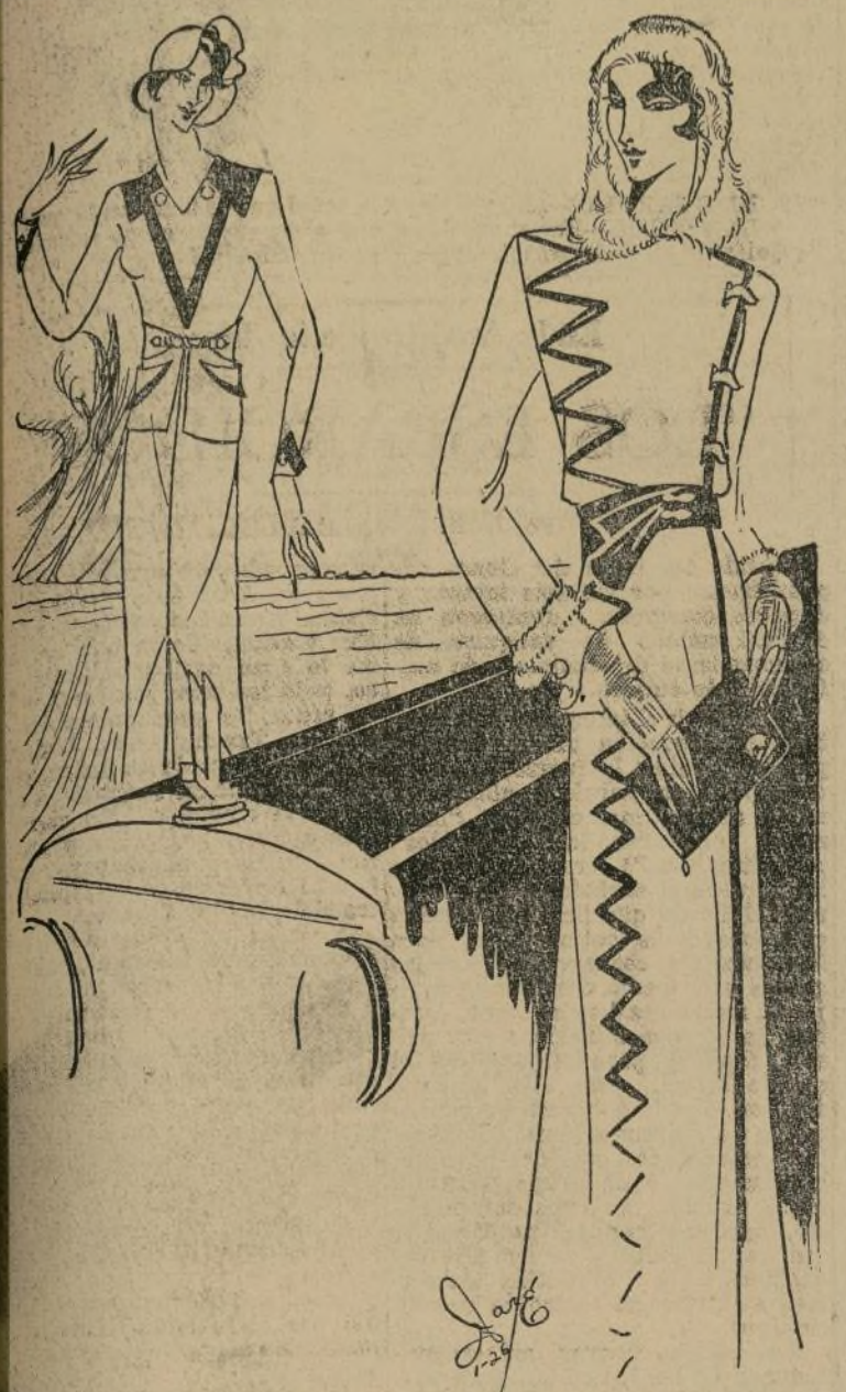
Rojas para deportes en gris, verde y blanco con abrigo en lana verde y cuello y puños de caracul blanco.

NEW YORK, enero 25. —¿Deberían los hombres usar sombreros de paja en el verano? La contestación es afirmativa. No porque los modistos pujan los modistos pujan, sino porque los modistos pujan los modistos pujan en sus colecciones ni porque parezcan los más apropiados para los días de sol, sino por una razón más importante y humana. ¡Por la variedad! Los sombreros prácticos de todo el año nos cansan y descamamos algo de color y variado. ¿Qué les parece el traje y abrigo deportivo que les diseño? ¡Elegantísimo! El traje es en tres colores combinados, que serán muy elegantes para el verano —gris quemado, verde y blanco. El abrigo es de lana verde obscura y el adorno blanco. Puede usarse completamente separado del vestido. La abrochadura es muy original, y el cinturón es de cuero negro, que lo hace lucir más chic. El cuello y puños son de caracul blanco. El cuello puede usarse en forma de caperuza si se desea, muy útil para los viajes en automóvil a toda velocidad con la capota bajada y el viento levantando molestias. En cuanto a colores, siempre se-