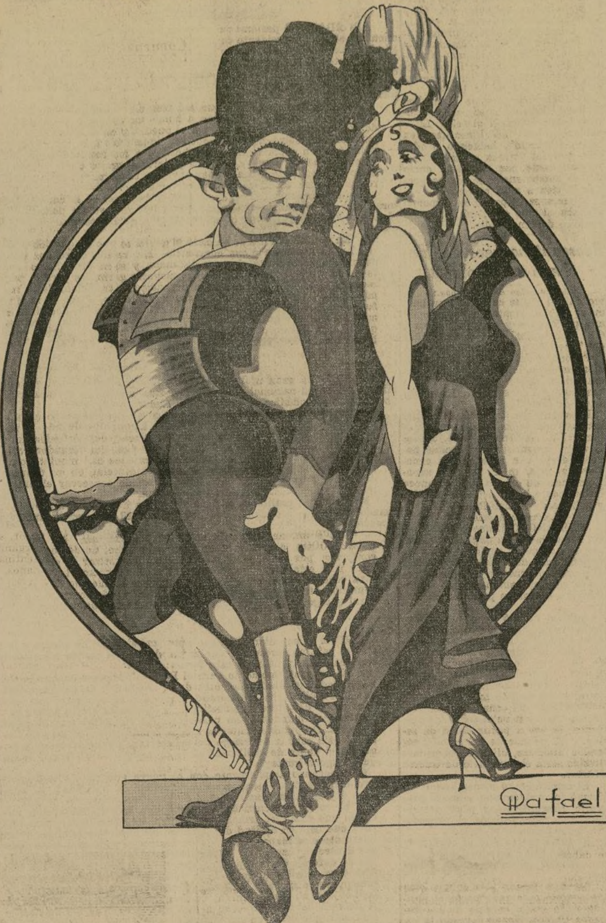
Saludado como una de las más grandes sensaciones de la temporada artística neoyorquina, Vicente Escudero—aquí interpretado por el dibujante costura de sus bailarinas, Carmita—será aplaudido de nuevo el jueves próximo, en el Chanin Theatre, en una nueva exhibición de sus bailes, antes de continuar Estados Unidos adentro en "invasión" de flamenco andaluz que tan celebrado ha sido aquí.