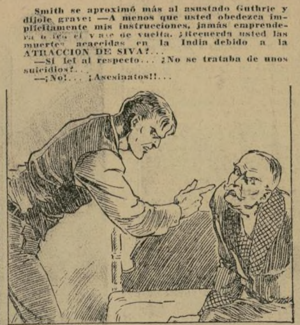
—Usted es comisionado británico en el Norte de Bluthay? en breve deberá regresar a vuestra patria. En India, terminadas vuestras vacaciones. Fu Manchu tiene intereses muy grandes en vuestro territorio, le precisa que allí se lea la bandera nacional, menos energía y alerta que usted. El territorio que usted, no regresará a Bluthay.

El ex secretario de Guerra Newton D. Baker, uno de los más entusiastas partidarios de la Liga de Naciones en las filas de la colectividad democrática, se declaró ayer opuesto a que se hiciera declaración de adhesión a dicha Liga en el programa político del partido nacional. “Yo no llevaría a los Estados Unidos a formar parte de la Liga si tuviese facultades para así hacerlo, hasta que no se evidenciara una gran mayoría de sentimiento bien informado y convencido, favorable a dicho paso, en los Estados Unidos”, declaró Mr. Baker poco antes de embarcar a bordo del vapor “Siboney”, con destino a Méjico, donde piensa pasar una temporada de vacaciones. Un rotundo “No” fué la respuesta de Mr. Baker al preguntarle los representantes de la prensa si él era candidato a la presidencia de la nación. Luego se expresó en el sentido de que la prohibición “evidentemente” no sería cuestión importante en la campaña política de este año.