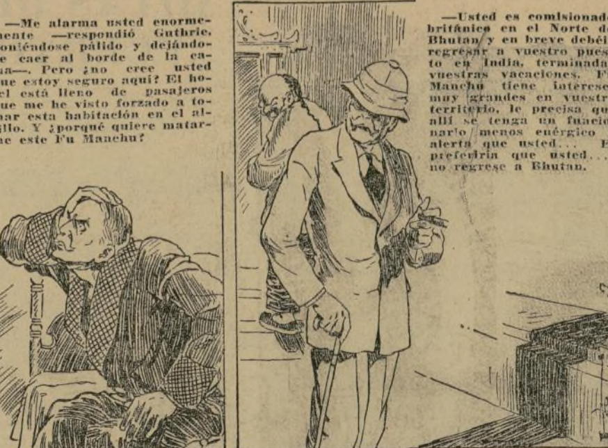
—Me alarma usted enormemente —respondió Guthrie, poniéndose pálido y dejando caer al borde de la cama—. Pero ¿cómo cree usted que estoy seguro aquí? El hotel está lleno de pasajes que me he visto forzado a tomar esta habitación en el último momento. Y porque quiero matar a este Fu Manchu.

No hay tiempo que perder en ceremonias inútiles, señor Guthrie. Son las 12 y 25. A las 12 y 30 se atentará contra vuestra vida. Fu Manchu.