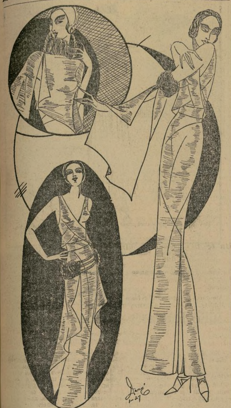
Lindo vestido para noche en lamé dorado, adornado con piel de marta

NEW YORK, enero 26.—Los vestidos de combinaciones son muy bonitos. Jeanne Lanvin dice que un solo detalle interesante es importante en un vestido. Esto quiere decir que si un traje tiene una falda, mangas o cualquier otro detalle original, el resto debe ser sencillo. Y que un solo detalle encierra toda la elegancia y chic en un vestido, éste por lo regular es la parte más cara del mismo. La Dama Elegante posee una sola pieza de zorro, pero adorna con ella varios vestidos. Este es un arte. Secretos de la habilidad femenina. El modelo que los diseñó es