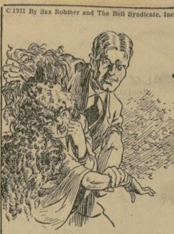
De pronto Smith se puso en alerta. El alarido del asesino venia en direccion de la manada...