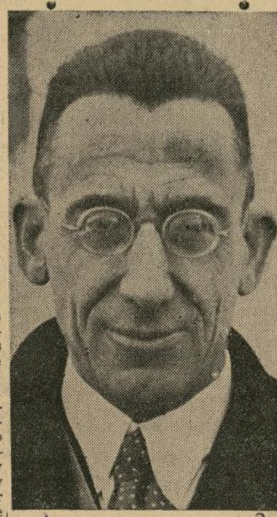
Don Luis Zulueta

GINEBRA, Suiza, febrero 12 (A).—El ministro de Estado, señor Zulueta, ministro exterior de España y delegado de la conferencia del desarme, en la sesión de hoy la abolió de la aviación militar y la internacionalización de la aviación civil.