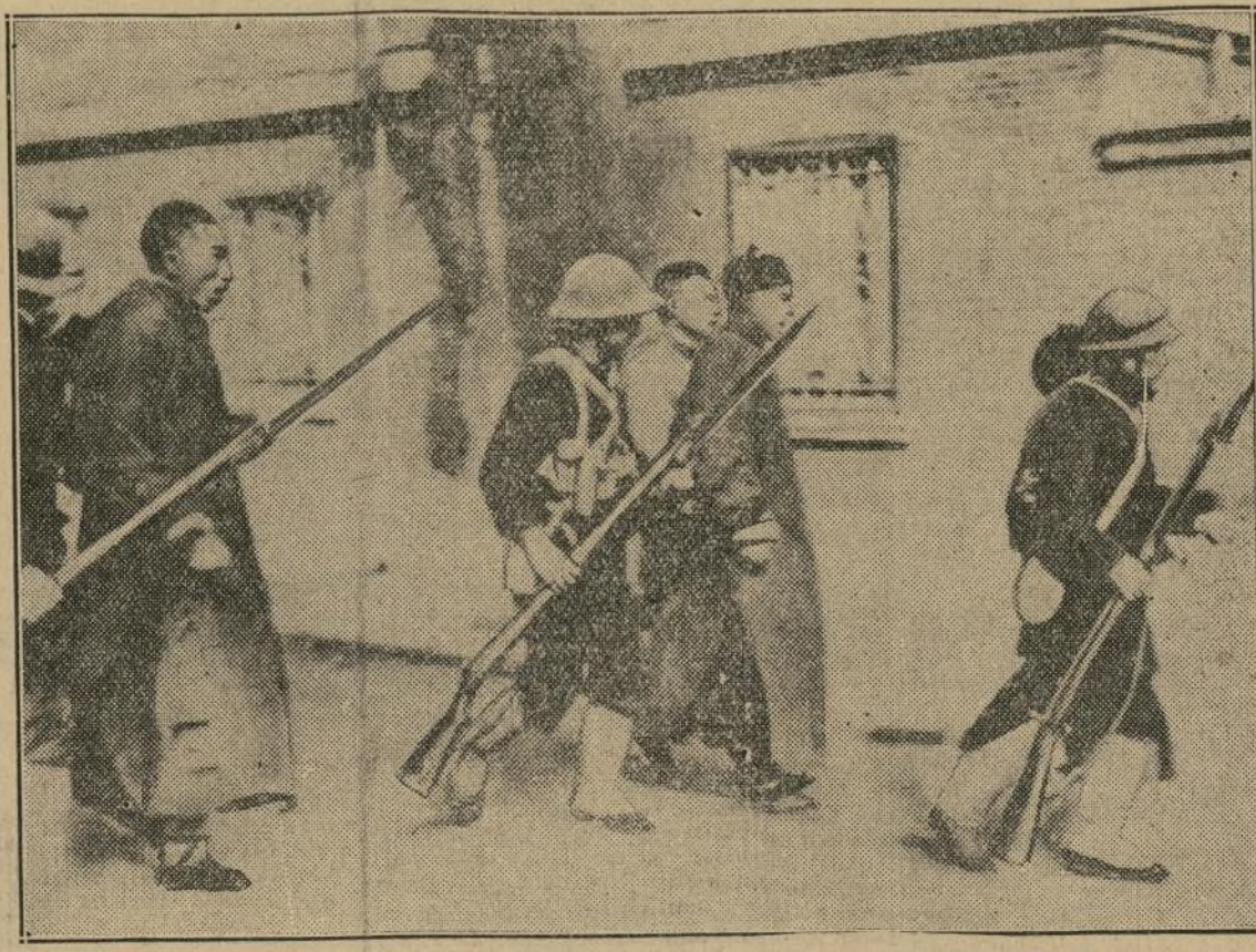
Esta dramática fotografía muestra a un grupo de ciudadanos chinos de Shanghai, conducidos por infantes japoneses a la corte marcial por estar acusados de hacer fuego contra los invasores de su patria. Como el consejo de guerra en estos casos invariablemente decreta la pena capital, puede pues muy bien decirse, que los infelices van marchando hacia la muerte.