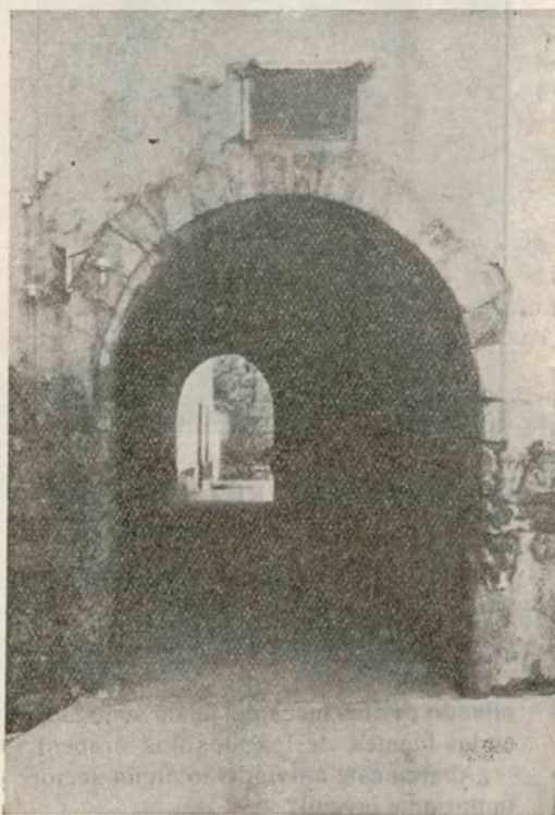
MELILLA.—Túnel de Santiago que da acceso a la antigua capilla del mismo nombre

y la riqueza acumulada, va realizando, poco a poco, en el mundo un principio de justicia social que alcanzará su máxima plenitud cuando llegue el día que, con el producto del trabajo, estén atendidas todas aquellas ineludibles necesida-