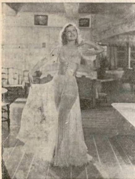
La bella estrella de la "Fox" LILIAN HARVEY