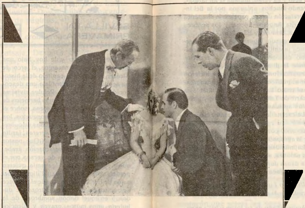
Catalina Bárcena y Antonio Moreno en una escena de la película «La Ciudad de Cartón» original de Gregorio Martínez Sierra

Que así sea, es el ansia de los españoles que aquí vivimos, con el pensamiento puesto en la mayor gloria, en el mayor engrandecimiento de España.—Mariano B. Aragonés