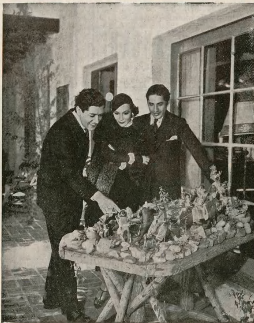
JOSÉ MOJICA y DOLORES DEL RÍO, admirando unas figuras de bronce en la residencia que el primero tiene en Santa Mónica