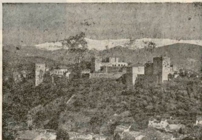
GRANADA — La Alhambra; al fondo Sierra Nevada

Una pequeña ensenada, que limitan al Norte la Punta Mercedes y al Sur Punta Isabel, formadas, respectivamente, por dos salientes del escarpado arenoso que caracteriza esta parte del litoral, da acceso a una meseta de 90 metros, elevada pocos kilómetros al Norte de la desembocadura del río Ifni. En aquella está el poblado de Idufker, y en la falda que desciende hacia la ensenada otro pequeño poblado, al que los indígenas llaman Amerdog. Próximas al primero se conservan algunas ruinas, que se cree puedan ser las del antiguo establecimiento español de Santa Cruz de Mar Pequeña.