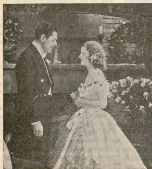
Janet Gaynor y Warner Baxter

en una escena de la película Fox «Paddy, lo mejor a falta de un chico»