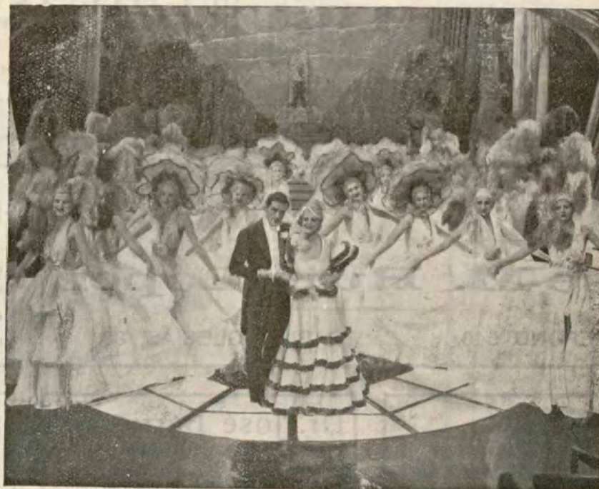
Un momento del film "Mademoiselle La"