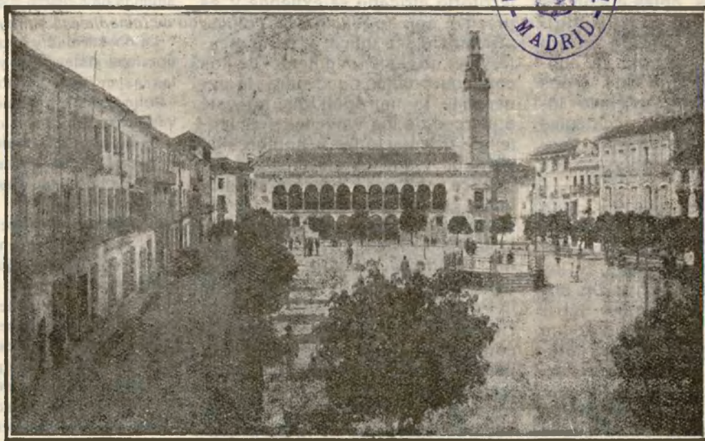
LUCENA (Córdoba) — Plaza de la República. Al fondo el Ayuntamiento

lucos, diluyendo esas estúpidas barreras de clases y de partidos que se combaten entre sí como especies diferentes biológicas en guerra inelectable. Un lema nos congregó y sólo este lema es la palabra auténtica de nuestra historia pasada y de nuestras necesidades actuales: «Para restaurar a Andalucía, la fórmula es simple: la de siempre: la de ahora: Tierra y libertad para vivir nuestras inspiraciones originales.» — BLAS INFANTE