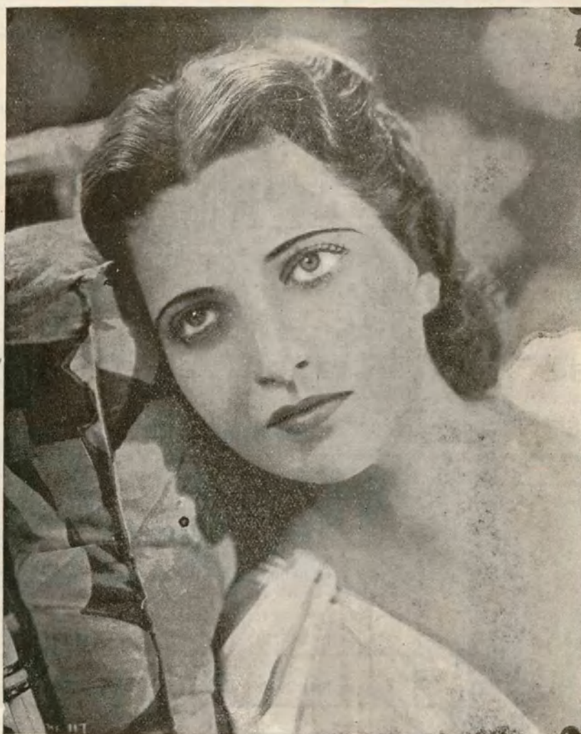
Kay Francis Gentil estrella de la pantalla