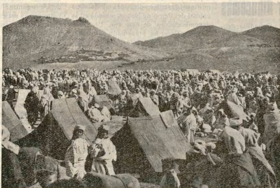
Zoco en la región de Ketama

Causa regocijo, no ya el estudio detenido, sino la simple ojeada de obras de la envergadura de esta de referencia, las cuales no van siendo ya raras en España, obras que, sobre la exaltación del ayer del país y la raza, ponen de manifiesto ese gran tributo que cabe ofrendarse en aras de la elevación nacional a poner en juego una voluntad animosa. Al igual que los tomos preceden-