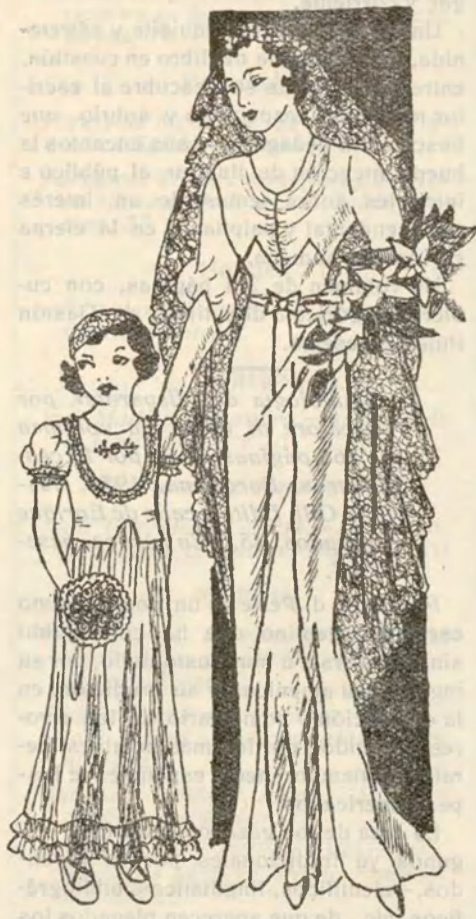
Elegantes vestidos de novia y niña para ceremonia nupcial

Felicidades a «La Valenciana, S. A.», por la edición de tan interesante como práctica Guía.