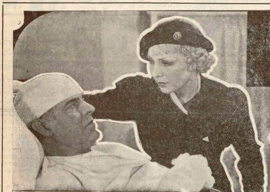
CATALINA BARCENA y ANTONIO MORENO, en una escena de «La Ciudad de Cartón».