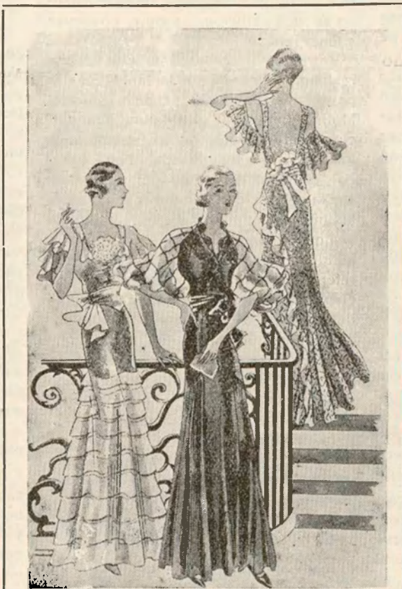
Interesantes modelos para soirée de confianza o «cocktail». El movimiento de los hombros dentro de la tendencia nueva de la moda.

en tul, batistas, sedas, etcétera, etc. En cuanto a la técnica del bordado es casi siempre el punto de cruz, y aunque hemos dicho admitían toda clase de colorido, los más característicos son los tonos vivos de azul y negro, rojo y negro; negro, azul y verde; amarillo y rojo, y aun admiten el anaranjado, azul, turco y negro.