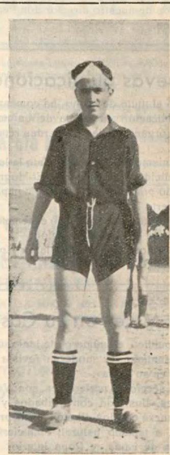
LOPEZ II Notable extremo izquierda del equipo MELILLA F. C.

Asistió bastante público, aunque no como otras tardes. — Selenófilo