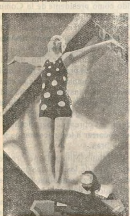
CLARA BOW Eminente estrella cinematográfica