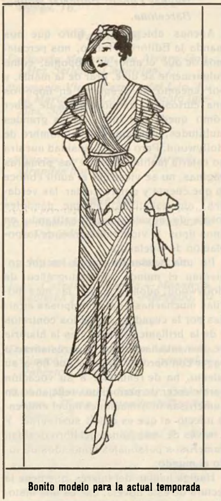
Bonito modelo para la actual temporada

El jazmín es un olor cruel, que provoca la mentira y el engaño.