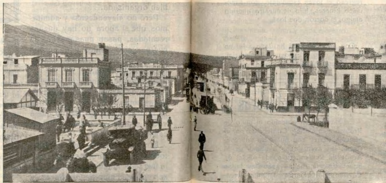
El populoso y simpático barrio del Real, que celebra estos días sus típicos y populares festejos

Ramón Novarro y Jeanette Mac Donal afirman que sus mejores vacaciones las pasaron... trabajando... pero en ocupación distinta a sus interpretaciones para la pantalla. Ambos disfrutaron infinito durante sus respectivas «tournée» de conciertos en Europa el verano pasado.