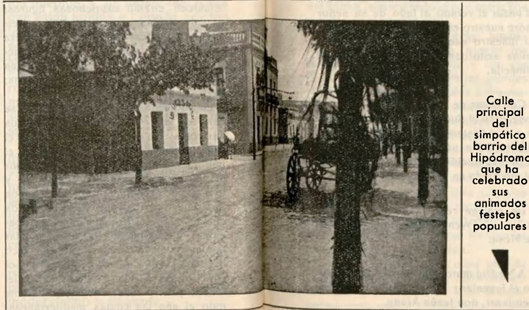
Calle principal del simpático barrio del Hipódromo que ha celebrado sus animados festejos populares

Mary y Douglas se casaron el 28 de marzo de 1920. Su feliz vida matrimonial y su mutua fidelidad han contribuido al prestigio entre el público de la industria cinematográfica. La labor interpretativa de Mary Pickford y la clase de películas que produce explican según la creencia popular, la ascensión de la estrella al pináculo de la gloria.