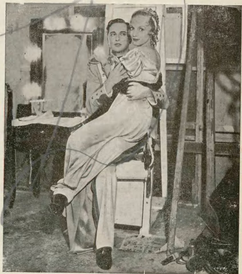
CONCHITA MONTENEGRO y RAUL ROULIEN, durante un descanso de la producción Fox «Granaderos del Amor»