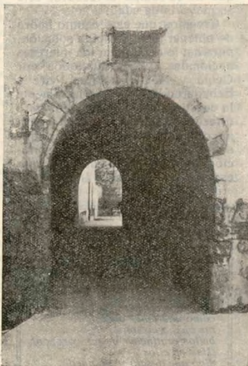
Túnel de Santiago