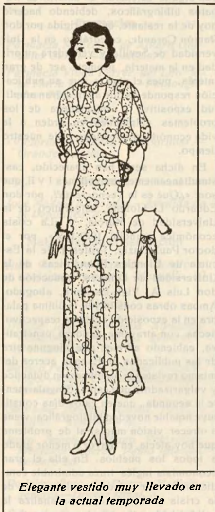
Elegante vestido muy llevado en la actual temporada

Las nuevas toquillas sin copa para de noche son de cinta de tul, habiendo encontrado gran aceptación entre las elegantes parisinas.