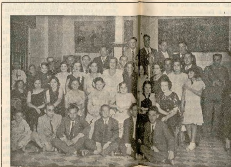
Club Deportivo Villa Alhucemas

«Yo ví nacer, como si dijera, tres de los cuatro caballos que poseo actualmente. He pasado muchos ratos con ellos, y los quiero tanto como podría querer a un hijo. Quisiera que llegaran a ser ejemplares magníficos, pero, aunque pierdan todas las carreras en que participen, les tendré el mismo cariño».