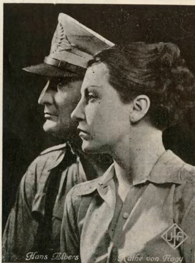
Hans Albers y Kathe von Nagy Protagonistas del fim BOMBAS EN MONTECARLO