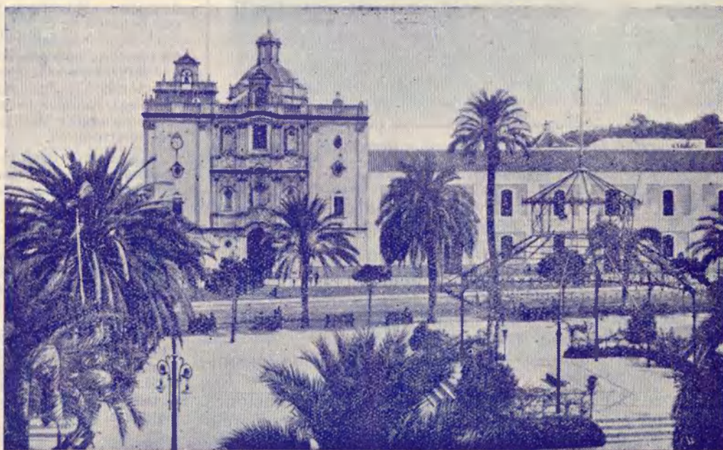
HUELVA. — Plaza de la República

Para final, hemos dejado la visita a la espléndida playa de Punta Umbría, única quizás entre todas las playas andaluzas. Y es tal el número de bañistas que