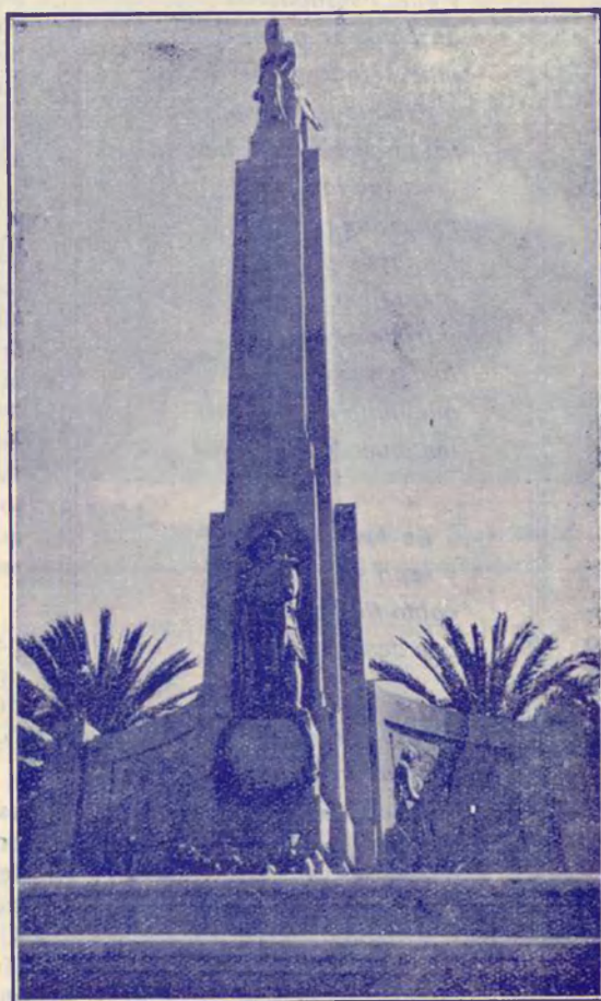
Hermoso monumento levantado en la Plaza de España, en homenaje al Ejército.

años de guerra impidieron la bella tarea en las cábilas insumisas. A la evolución siguen las transformaciones y los adelantos del saber. Más tarde vendrán los verdaderos avances y progresos en lo físico,