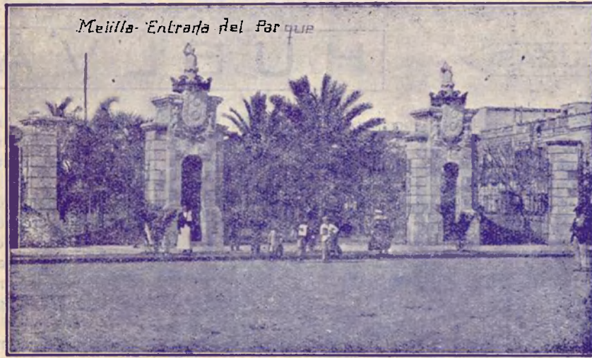
MELILLA.—Entrada del magnífico Parque Hernández