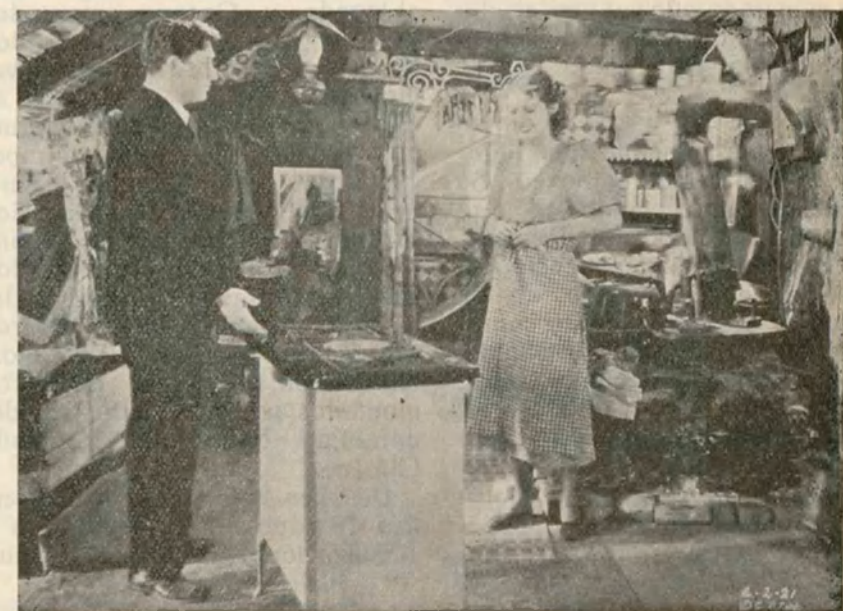
Spencer Tracy y Loretta Young felices intérpretes de la superproducción Columbia, en español, FUEROS HUMANOS que «Cifesa» nos presentará en la temporada que se avecina.