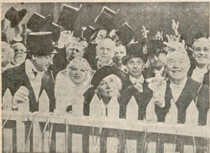
May Robson, Glenda Farrell, Warren William y otros principales intérpretes de la magnífica película Columbia DAMA POR UN DÍA en una escena de la misma. La dirección de este extraordinario film corre a cargo del genial Frank Capra, y de su distribución en España la prestigiosa marca valenciana «Cifesa».

El día 13 y en el mismo campo se celebró el tan ansiado encuentro entre el Cartagena F. C. y el ídolo