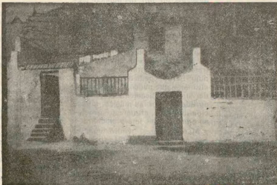
MÁLAGA.—Una calle de la moruna Alcazaba

Alben Batud, que visitó esta Mezquita en 1360, dice que era muy grande, célebre por su santidad y que poseía