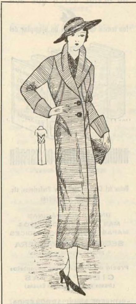
Abrigo para otoño, de «laine» asargado, adornado simplemente con alamares y cerrado con dos grandes botones

Deseamos una muy próspera vida a la nueva revista de teatro.