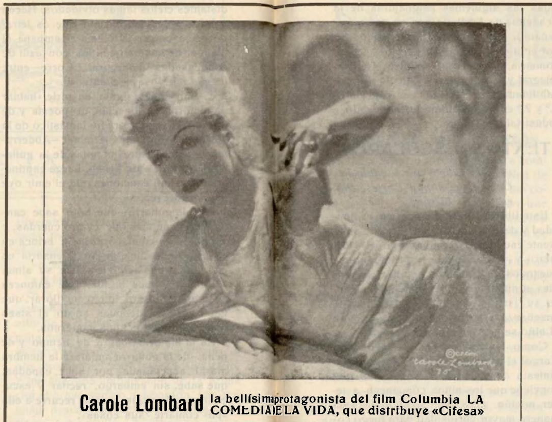
Carole Lombard la bellísima protagonista del film Columbia LA COMEDIA DE LA VIDA, que distribuye «Cifesa»

Fué primero en Madrid, en el lujoso y elegantísimo «Astoria», donde inició su campaña de triunfos, permaneciendo en cartel du-