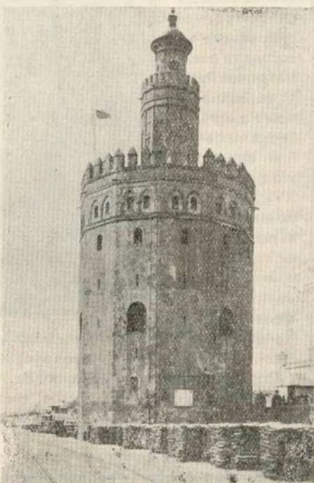
SEVILLA.—Torre del Oro

mía y el velo más espeso, a un tipo de vida casi anglosajón. Ni el caso interesantísimo de Siria, donde más de la tercera parte de la población indígena de raza y lengua árabe, ha emigrado a Nueva York, Buenos Aires, Río de Janeiro,