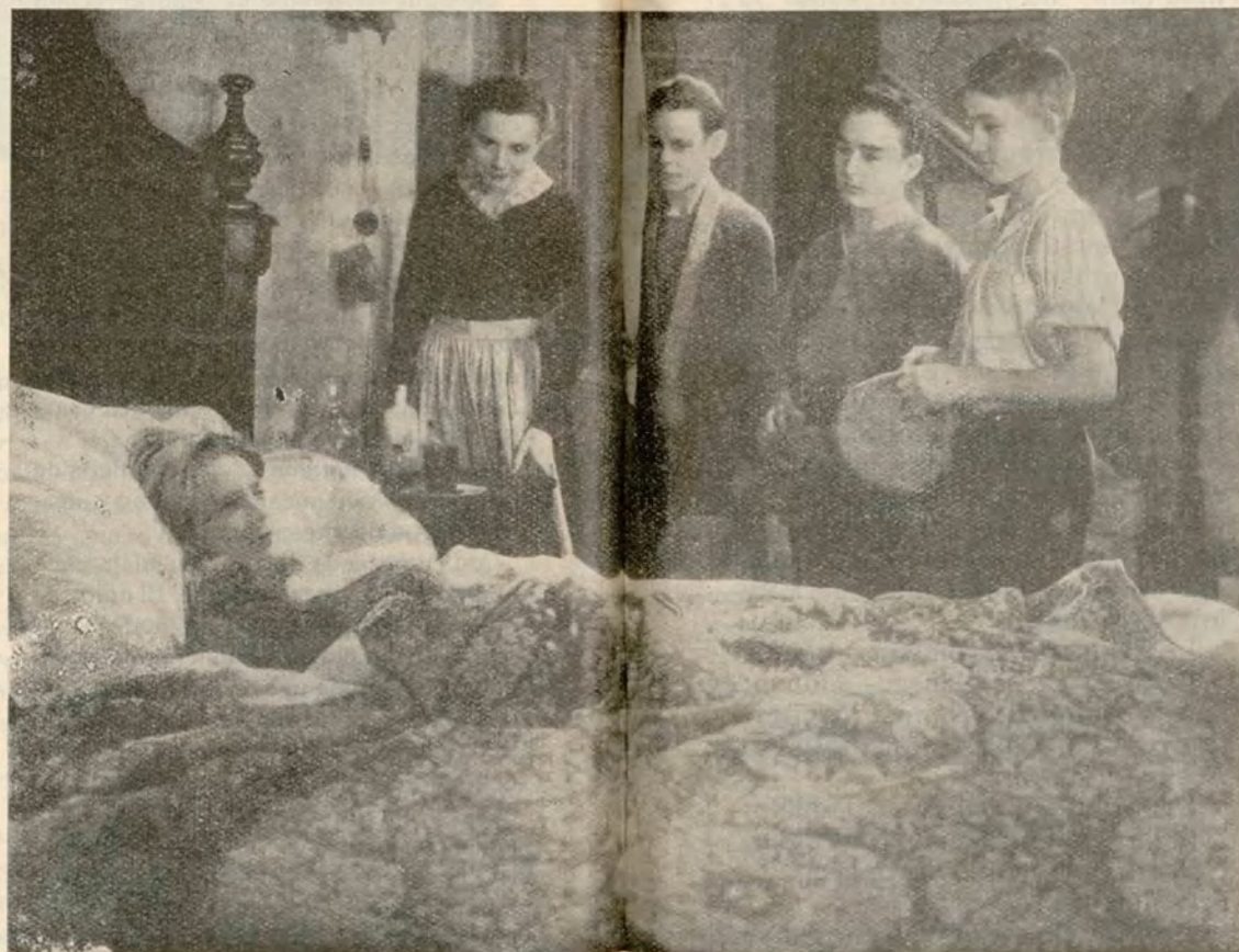
Una interesante escena de la producción Columbia-Cifesa HOMBRES DEL MAÑANA, que próximamente se presentará en nuestra ciudad