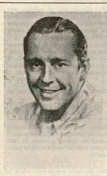
James Dunn, que aparece junto a Shirley Temple en «Gracia y Simpatía» y «Rayito de Sol», dos éxitos de la Fox para esta temporada

El pueblo es libertado y al fin Tanya y Sergio pueden partir a San Petersburgo en busca de su felicidad.