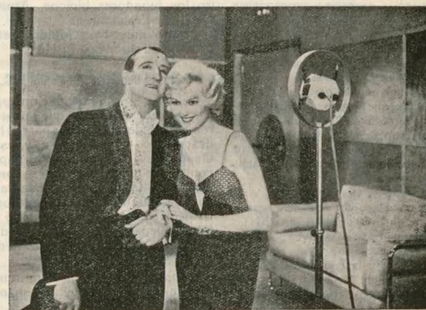
«Vaya Niña» es una divertidísima comedia de la marca British Internacional que distribuye la prestigiosa entidad «Cifesa». en el presente grabado aparecen Thelma Todd y Stanley Lupino, protagonistas

Y creemos no es necesario repetir más juicios de la crítica cuando toda se ha mostrado unánime en elogiar «La mujer de mi marido».