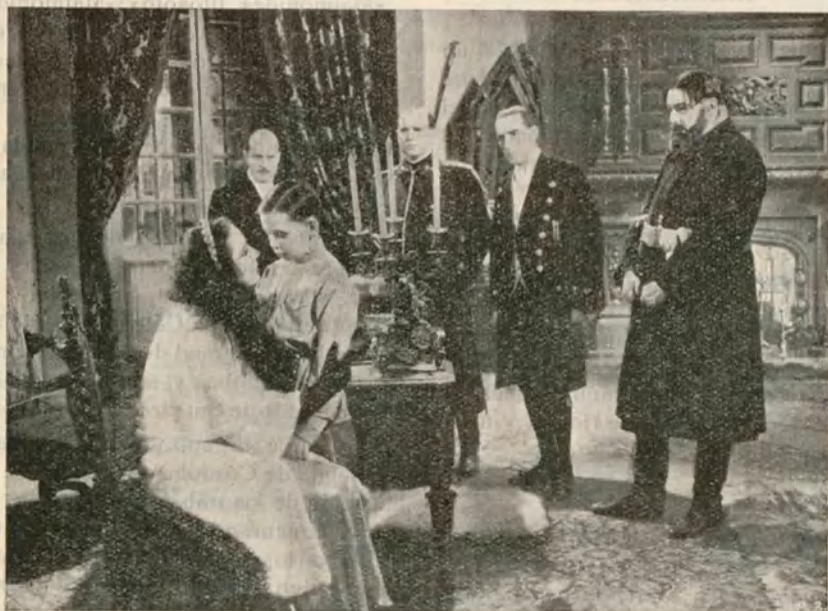
Una escena de la interesantísima producción «Fedora» basada en la obra de Victoriano Sardou, y que presenta la distribuidora valenciana «CIFESA» en la presente temporada

El estreno en la capital de España de la linda comedia «La mujer de mi marido» presentada por Co-