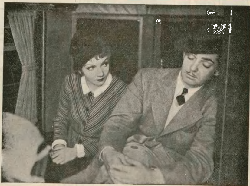
Claudette Colbert y Clark Gable, protagonistas de la misma divertidísima producción «Columbia» que distribuye CIFESA.