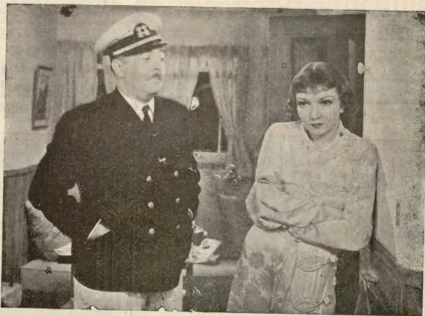
Claudette Colbert y Walter Conolly en una escena de la película COLUMBIA-CIFESA Sucedió una Noche