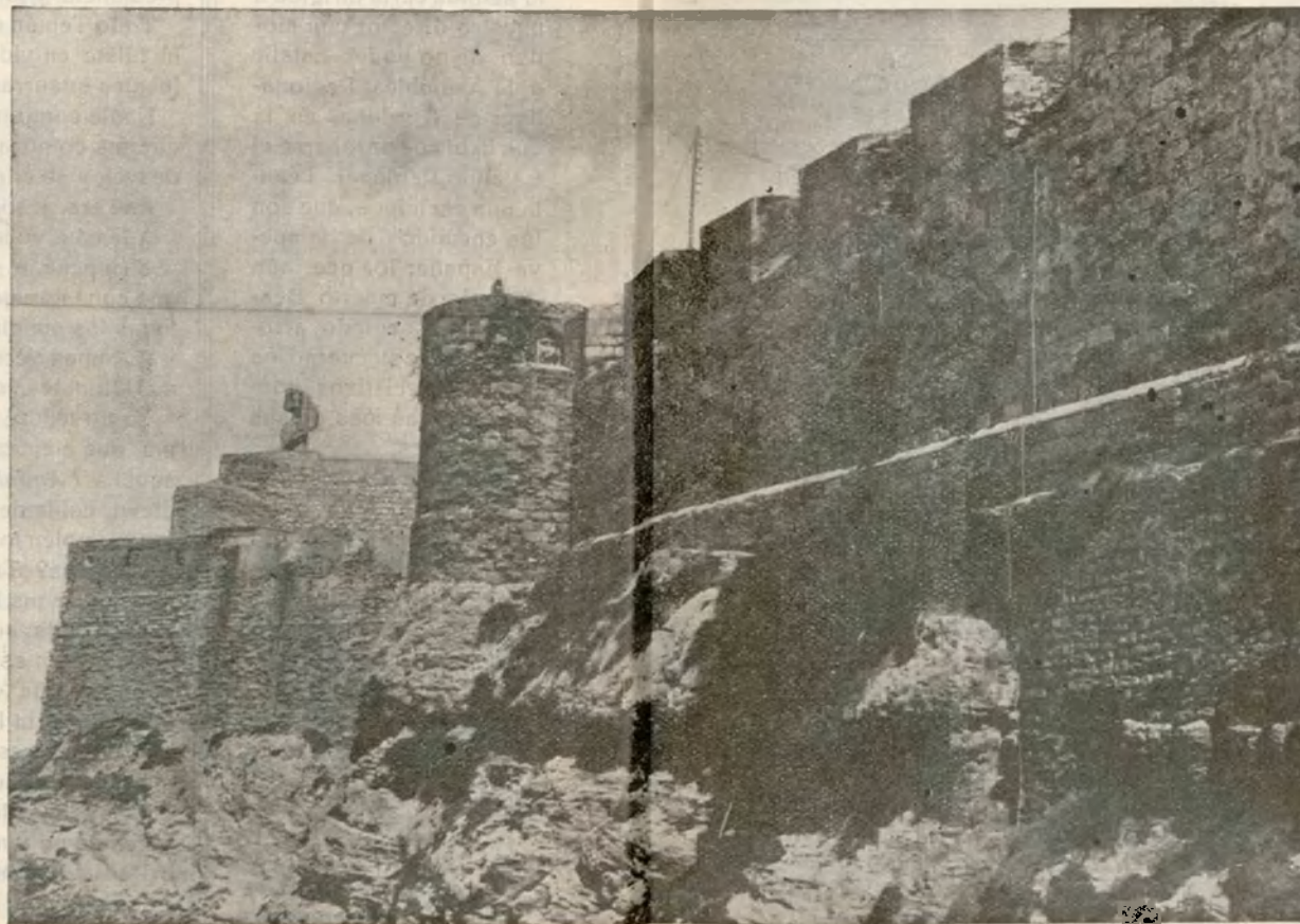
Las viejas murallas de la vieja ciudad melillense, hablan al viajero con la fogosidad irresistible de sus carcomidos torreones...