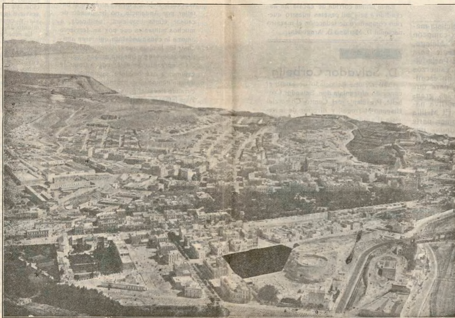
Vista de Melilla desde la desembocadura del Rio de Oro