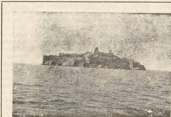
El Peñón de Alhucemas, ayer desafiador y gallardo y que hoy vive solamente de los pasados y gloriosos recuerdos.