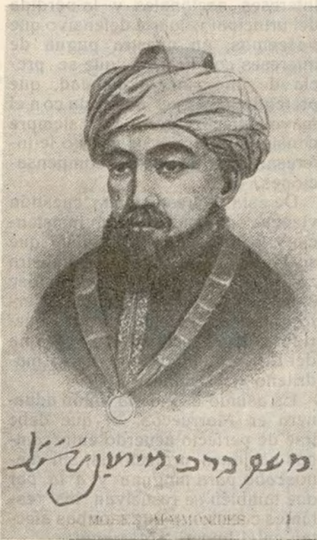
El insigne polígrafo andaluz Maimónides, cuyo VIII centenario de su nacimiento, celebra España.

marroquíes; en árabe redactó, ya en Egipto, la «Elucidación», bello comentario acerca de la «Michna»; en árabe dirigió su «Epístola de consuelo» a Jacob Alfayumí y a las