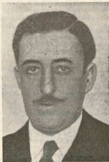
El eminente jurista don Felipe Sánchez Román, prestigioso jefe del Partido Nacional Republicano, cuya reciente conferencia en el Ateneo de Madrid acerca del tema «La propiedad de la tierra en la Constitución», ha constituido un resonante triunfo.

Llevo caminando varias horas sin descansar. Mis dos pies cristianos tornan al Barrio de Adua donde ojos y corazón se llenan de evocaciones y recuerdos. Aquí vivieron los moros-españoles; edificaron esta Mezquita del Andalus y esta Medarsa Sebaina doede fué enseñada la ciencia de los Fakies sabios de Córdoba y las siete maneras de leer el Korán que