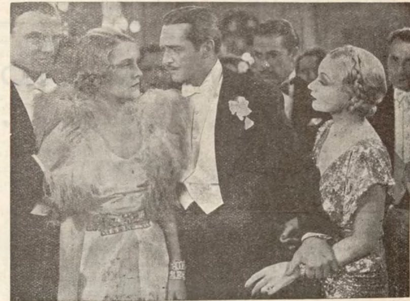
Otro de los momentos de la superproducción «Columbia-Cifesa» ES HORA DE AMARNOS