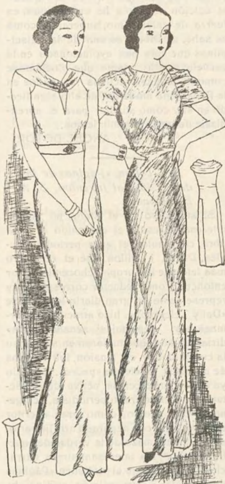
Bonitos trajes de noche muy en boga

Se confeccionan Vestidos, Abrigos y trajes de noche