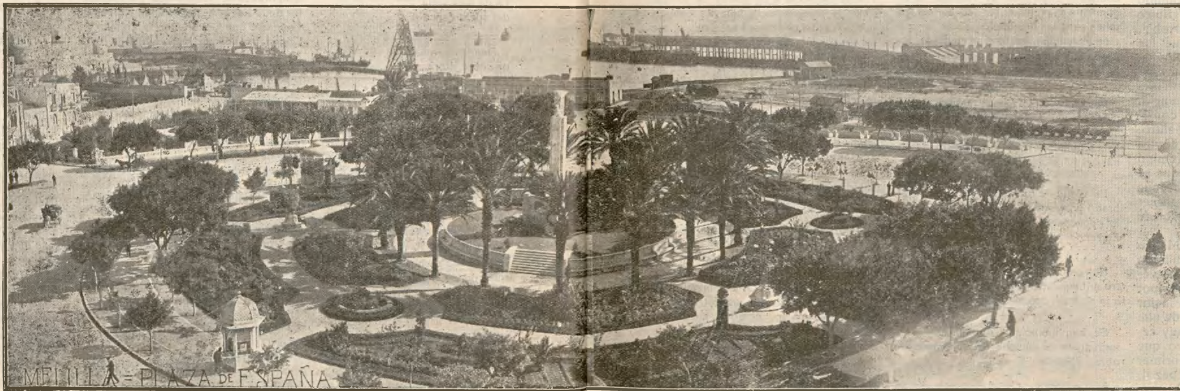
Melilla: Vista general de la Plaza de España. Al fondo, el puerto.

Completará el programa otras interesantes pel- lículas.