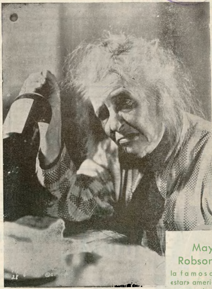
May Robson la famosa «star» ameri- cana que ha-

ce una verdadera creación de su «rol» en la película Columbia-Cifesa Dama por un día