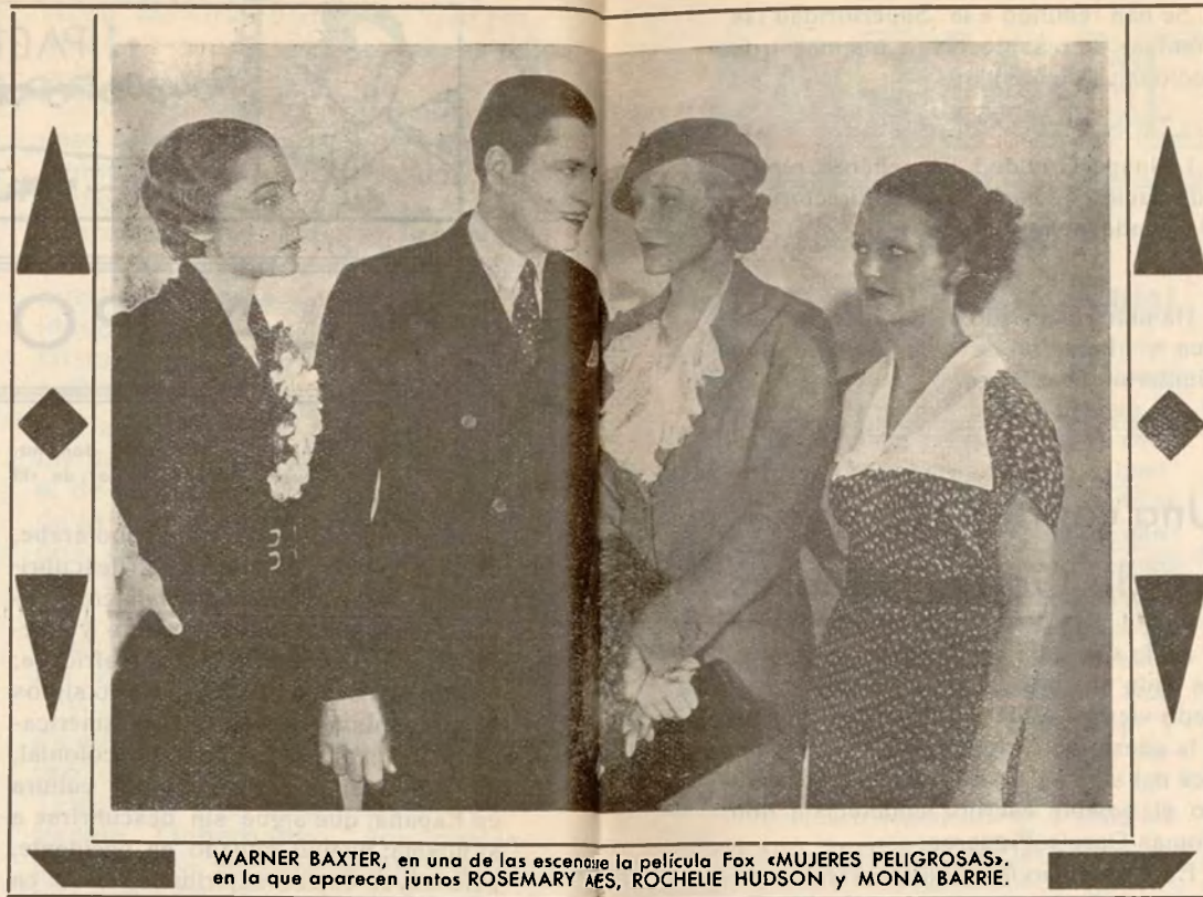
WARNER BAXTER, en una de las escenas de la película Fox «MUJERES PELIGROSAS», en la que aparecen juntos ROSEMARY AES, ROCHELIE HUDSON y MONA BARRIE.