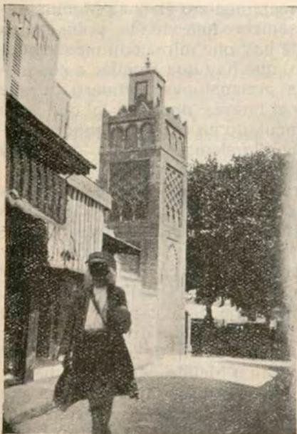
TLEMCEN.—Mezquita de Sidi-Ben Hassen, convertida hoy en Museo

Conserva la población una vieja ciudadela turca y varias mezquitas de refinado gusto arquitectónico, entre las que sobresalen la gran Mezquita de Sidi-Ben-Hassen, (hoy Museo de antigüedades) y la de Sidi-el-Halquí; y la ciudad toda está rodeada de ruínas de santua-