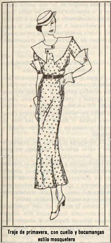
Traje de primavera, con cuello y bocamangas estilo mosquetero