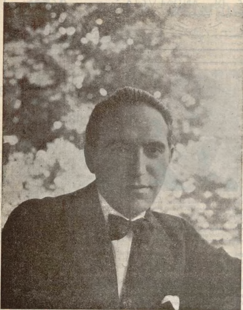
El sabio médico español D. GREGORIO MARAÑÓN, que ha dado en nuestra ciudad una hermosa conferencia organizada por el Colegio Oficial de Médicos