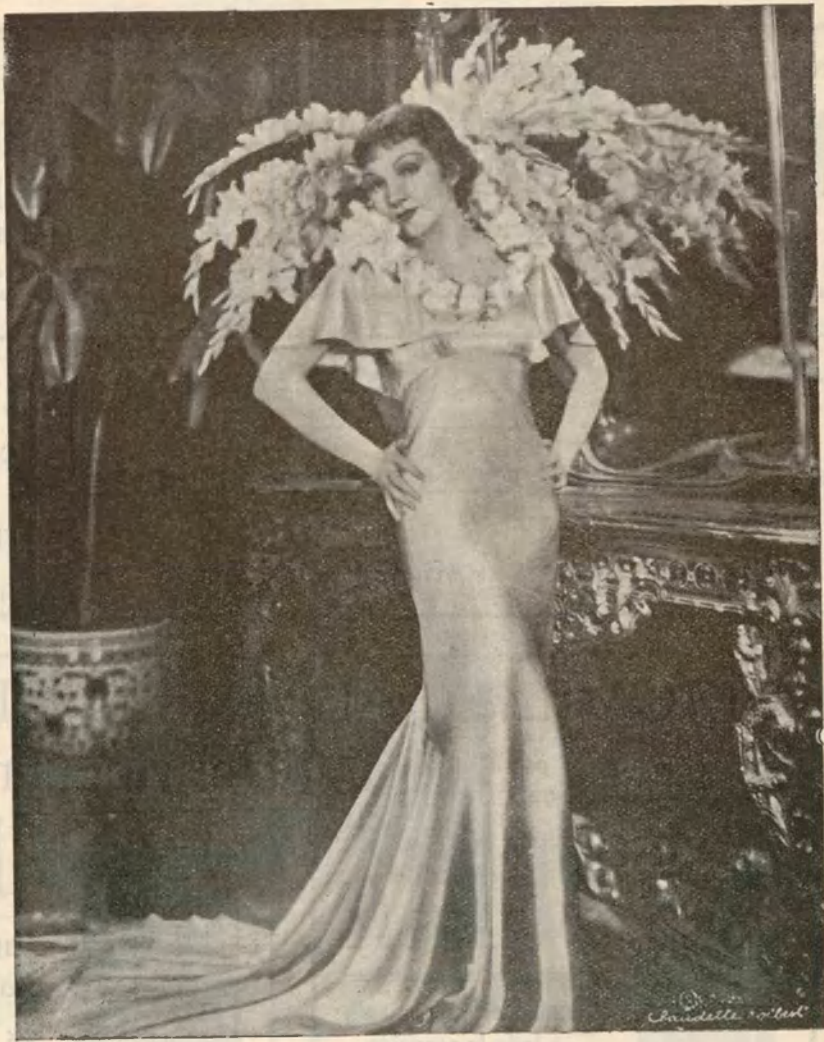
CLAUDETTE COLBERT la bellísima y genial estrella de la pantalla