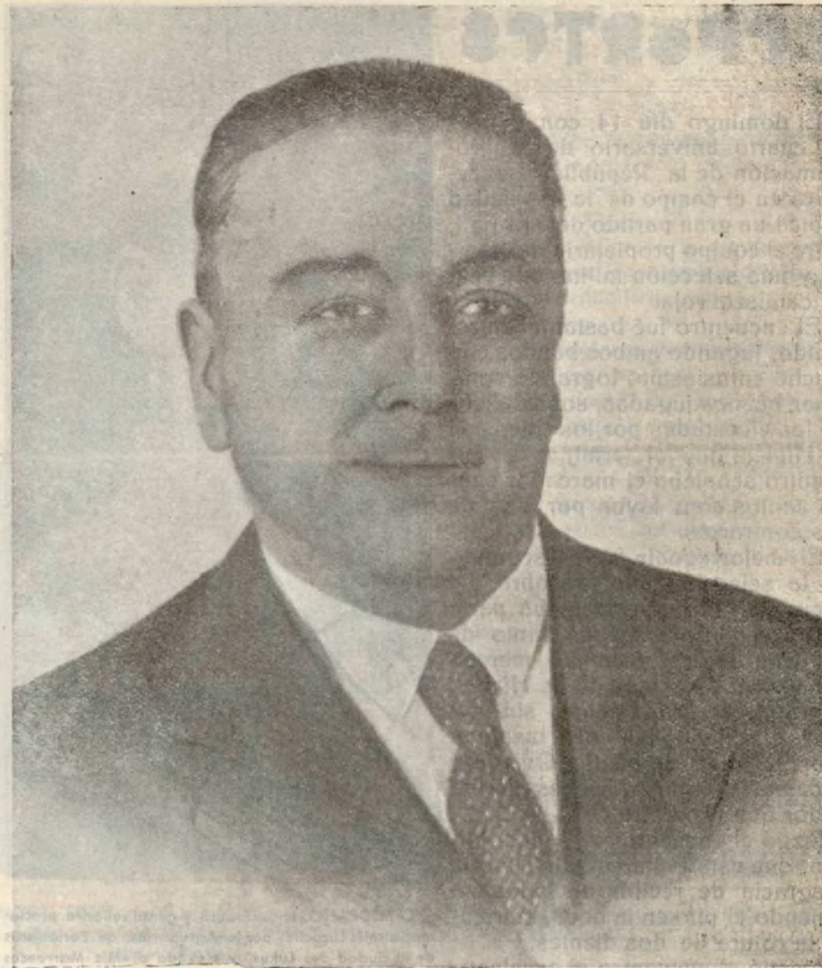
El expresidente del Consejo de Ministros y Presidente del Partido de Unión Republicana, D. DIEGO MARTÍNEZ BARRIO, que en propaganda política ha visitado nuestra ciudad, celebrando importante acto