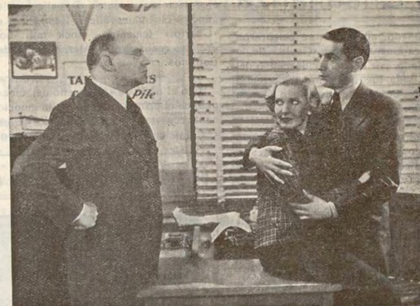
Otra escena de «El Remolino», que distribuye la entidad valenciana «Cifesa».

Cuando las películas eran mudas, cada director se ocupaba del recorte de las películas por él dirigidas. Actualmente, cuando todas tienen sonido, el trabajo se ha hecho mucho más complicado, porque además de todo el que era necesario hacer anteriormente, hay que agregar a cada lado de la cinta una tira angosta de celuloide, con la impresión del sonido, el cual debe ser rigurosamente sincrónico con la acción.