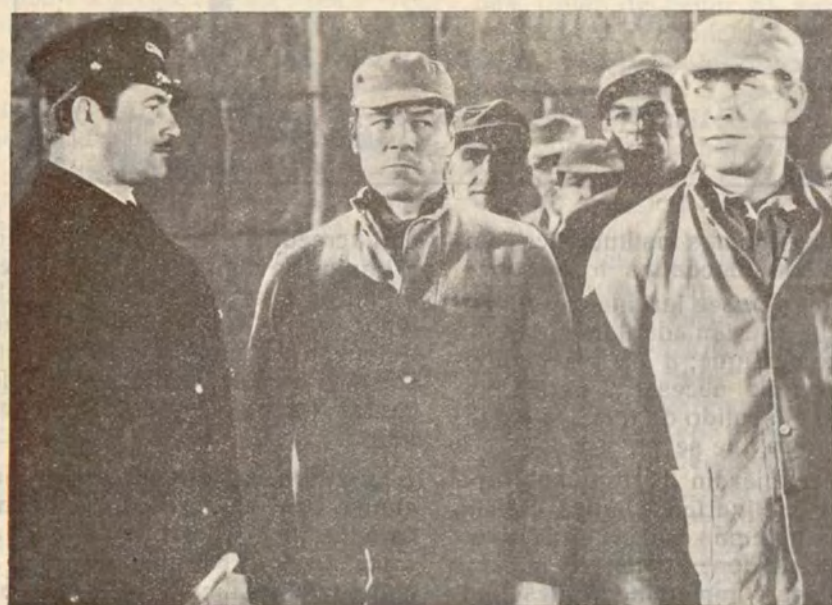
Una interesante escena de la producción Columbia «El Remolino»