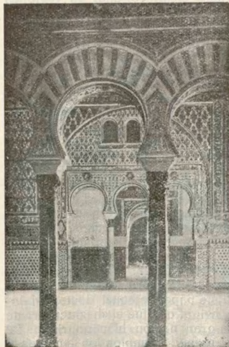
ALCAZAR DE SEVILLA.—Salón de Embajadores

Los cursos de la Karamina cuentan matriculados más de 300 estudiantes de los cuales saldrán los profesores, los funcionarios públicos, los Kadfes, los Ministros del Majzen y la intelectualidad avanzada del Islam occidental. Un profesor me narra la festividad anual de estos «tolbas» en que durante 24 horas uno de ellos es elegido Sultán, en conmemoración de una tradición gloriosa. Fez conserva el pasado como una sublime reliquia.