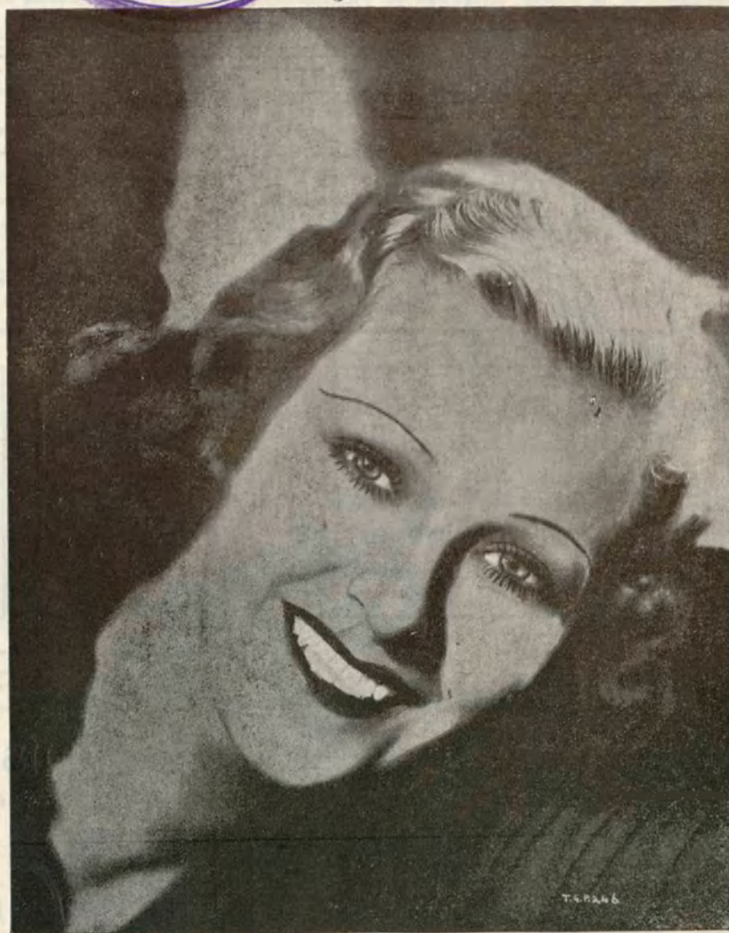
Jeanette Mac Donald

Una de las más simpáticas y atrayentes figuras de la pantalla americana. ♦ ♦ ♦