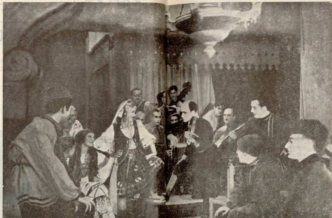
Una escena de la película de corto metraje de Cifesa «Romancero», protagonizado por la españolísima estrella Imperio Argentina

No podía Francia,—y mucho menos su partido colonista—sostener el ofrecimiento hecho en el famoso tratado secreto. Su no fir-