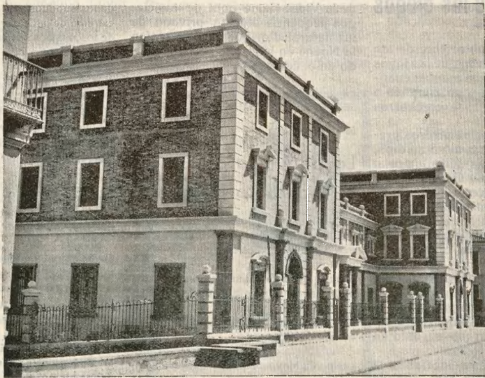
Magnífico edificio destinado a Instituto Oceanográfico inaugurado recientemente en la capital malagueña

legar a la Perfección, una Era menos espinosa, más bella y más humana: El talismán de poder cambiar la faz del mundo os es privativo, Madres. ¿No habéis meditado nunca sobre la grandiosa potestad de que sois dueñas?