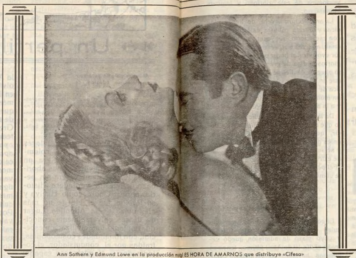
Ann Sothern y Edmund Lowe en la producción musical ES HORA DE AMARNOS que distribuye «Cifesa»

Y llega a más la innata ceguera de nuestros estadistas. Siempre han procurado, por todos los medios imaginativos, poner frente a frente a Marruecos con España; cristianos contra moros; la Cruz frente a la Media Luna. Si no había motivos para declarar la guerra, se inventaban. Los más baladíes servían como pretextos para organizar expediciones contra los infieles. Recuérdese aquel caso en que, para consolidar una situación política, la de O'Donnell, se fué a la guerra de Tetuán, en la cual, después de tanta san-