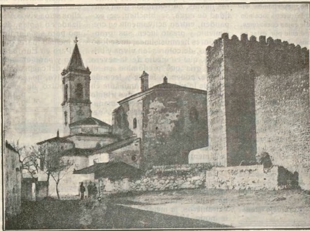
CUMBRES MAYORES: Bonito pueblo de la serranía huelva

les magníficos en los espiritual, para vivir en lo futuro unida a toda América y al Islam que añora su España Califal. Dejando a un lado las guerras coloniales y las de religiones, hoy el mundo avanza por otros senderos más en armonía con los fines civilizadores de la Humanidad. España, pueblo de Quijotes idealistas ha de llenar cumplidamente su misión en Marruecos, en Tánger, en Ifni y Rio de Oro, en Guinea y demás pueblos africanos que son lo único que nos que-