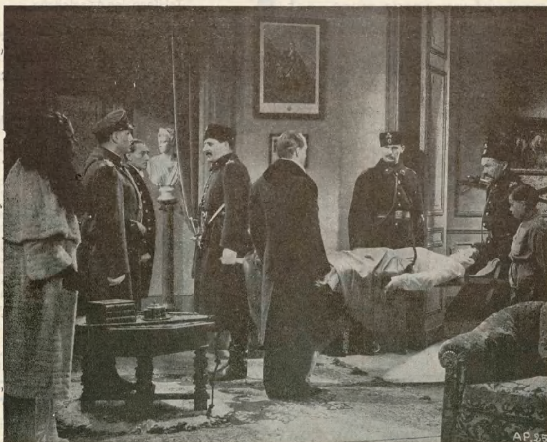
Una emocionante escena de la producción francesa de Sardou, «FEDORA», distribuida por CIFESA

Año X — PUBLICACION SEMANAL ILUSTRADA. — Núm. 456