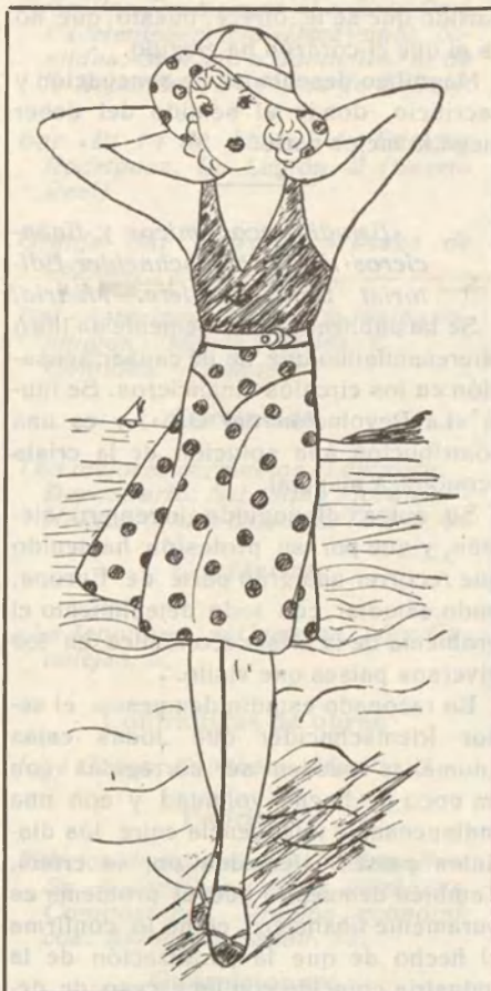
Lindo traje de playa, blanco y rojo, para niñas de ocho a diez años

150; debe añadirse crema espesa disolviéndola en leche perfumada, tintura de benjuí, almizcle y algunas gotas de cintrusa.