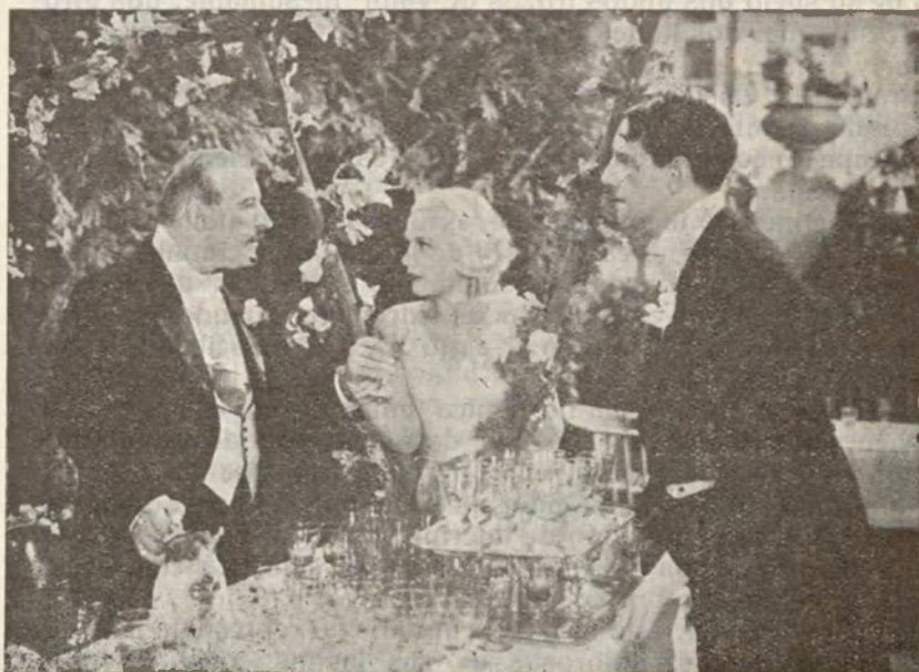
Una escena de la producción «Transocean Film» ROSAS DEL SUR, que distribuye «Cifesa»

Y para unir a la lista de material español integrado por diez o doce films españoles, Cifesa, sabemos está seleccionando lo mejor que se produce actualmente en los estudios de Alemania e Inglaterra, con el fin de poder ofrecer a nuestro público el mejor programa de cine por su calidad, fotografía, sonido e intérpretes, que figure en las bandas, tanto nacionales como extranjeras.