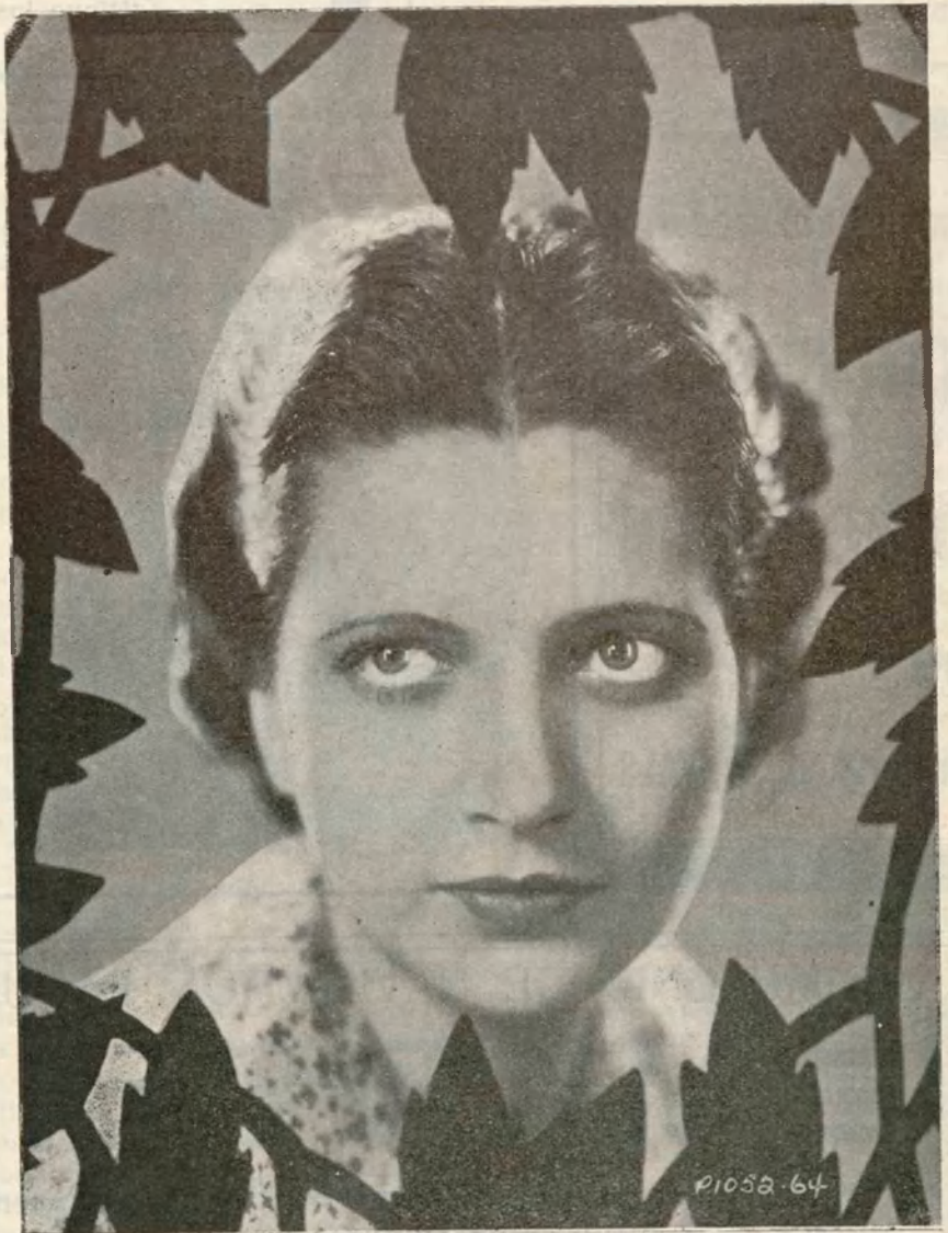
◀ KAY FRANCIS ▶