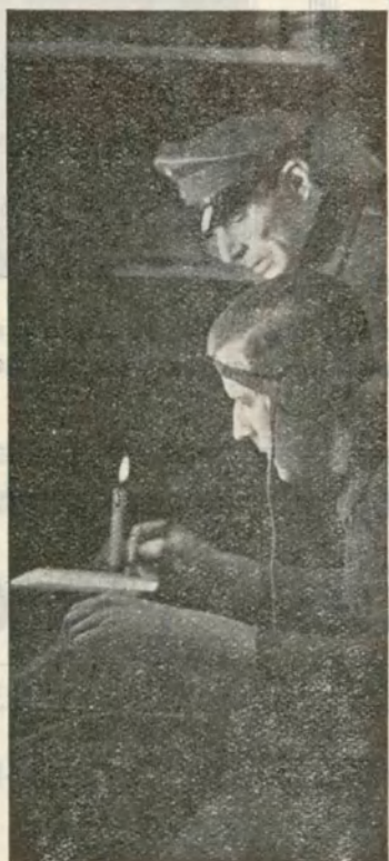
«AYER... 1917» grandiosa producción alemana que «Cifesa» presentará en la próxima semana

Es un film distribuido por la conocida marca «Cifesa».