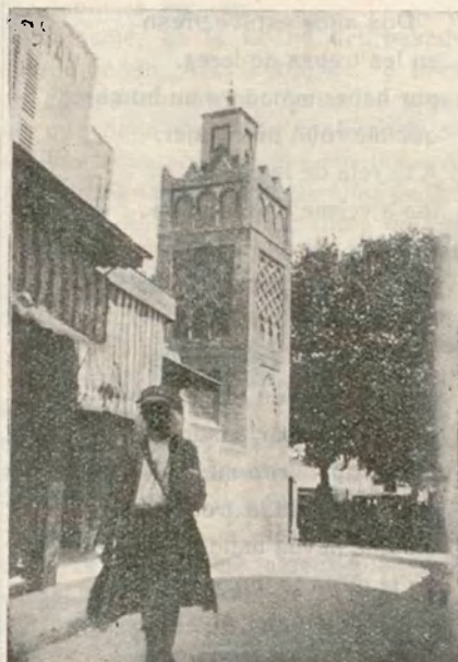
TLEMCEN. — Mezquita de Sidi-Ben Hassen, convertida hoy en Museo

y España. Era preciso borrar los obstáculos tradicionales que se oponían a su desenvolvimiento; acabar con los excesos que sufrieron muchas veces ingleses, franceses y españoles.