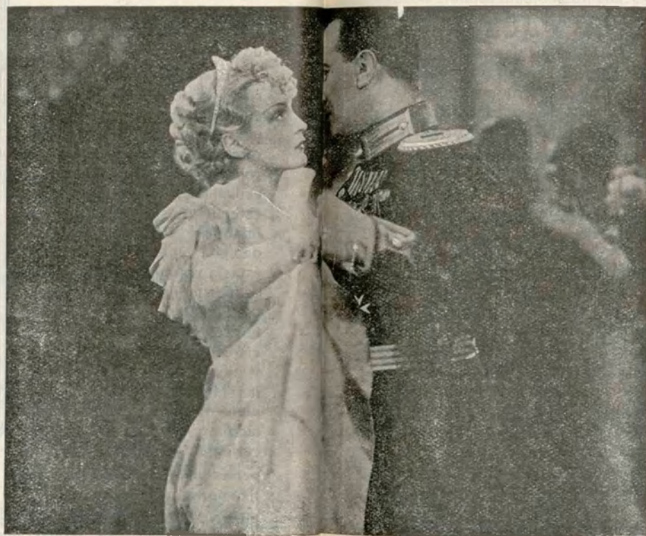
Uno de los bellísimos momentos de la película alemana FIESTA EN PALACIO que presenta CIFESA