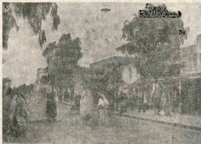
Calle de Sidi Buhamed, de Alcazarquivir

sados en la marcha incesante del Progreso, dormidos a toda sugerencia, era preciso despertarlos de su largo sueño. Ya han empezado a recobrar las energías perdidas, a sacudir la acidia que les originaba el bochornoso viento del Sahara, enervador de voluntades y apatencias.