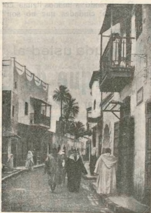
ALCAZARQUIVIR.—Calle de las Palmeras

de ambos pueblos; lo prueban las mismas Leyes de Indias, que, no obstante haber sido consideradas injustamente por los americanos,—creando la Leyenda Negra, destruída hoy—, fueron las más benignas que se hayan conquistado y practicado. Lo prueba el ejemplo de los árabes españoles y sefardíes, que, expulsados de España en 1492, conservaron el idioma español y el culto de las tradiciones peninsulares. Lo prueba el hecho de que mientras las demás nacio-